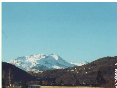
vue sur village