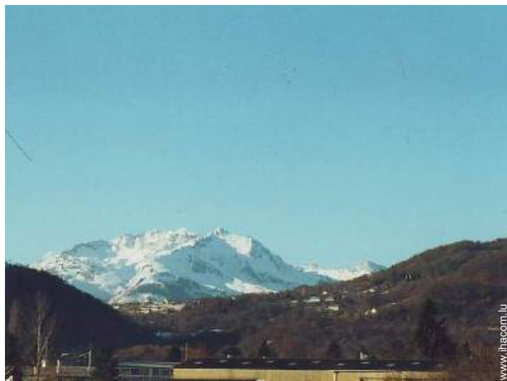
vue sur village