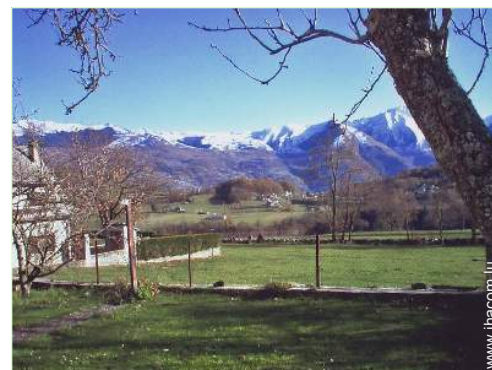
vue sur montagne