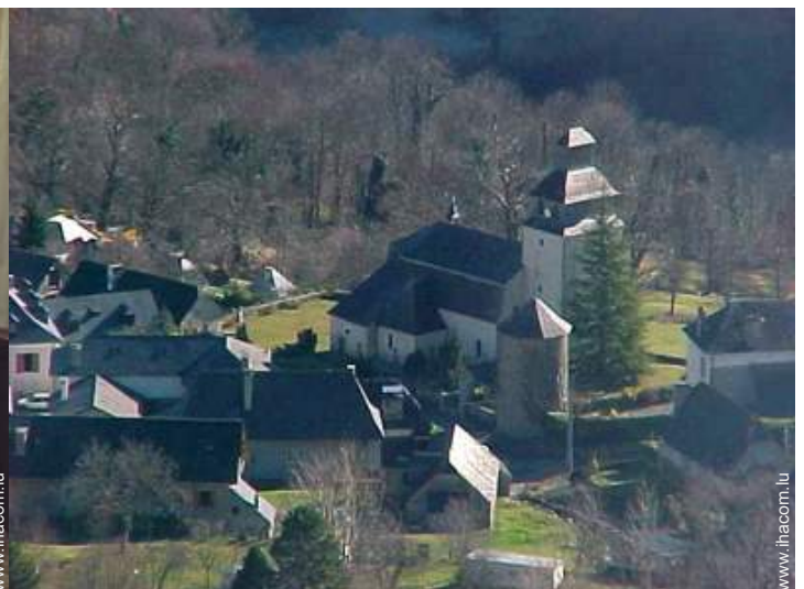
vue sur centre village