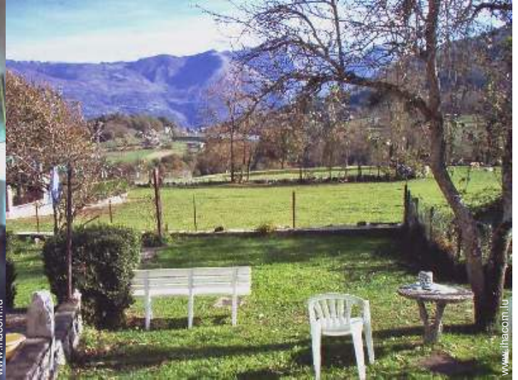
vue sur lac