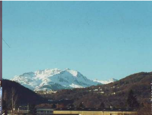
vue sur village