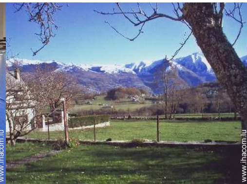
vue sur montagne