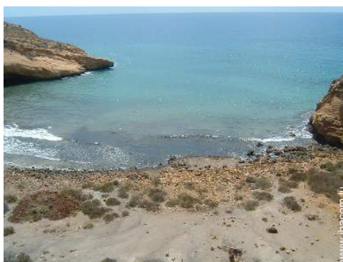
plage de naturisme