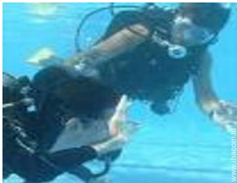
loisirs nautiques à proximité