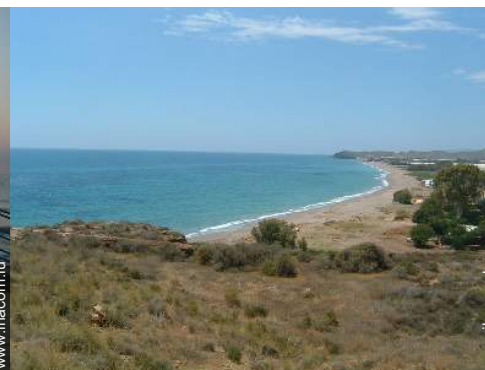
loisirs d'été à proximité