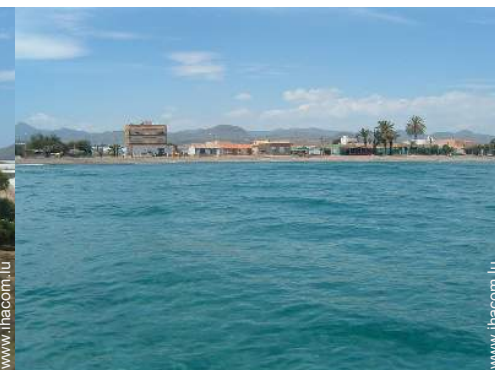
loisirs nautiques à proximité