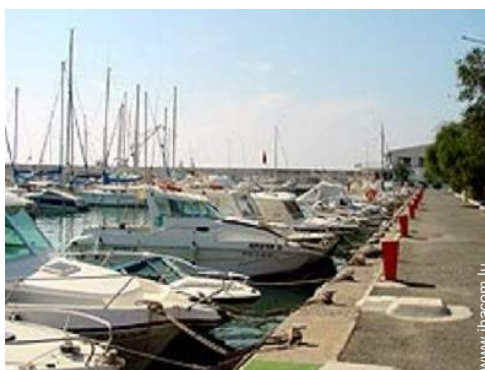
loisirs nautiques à proximité