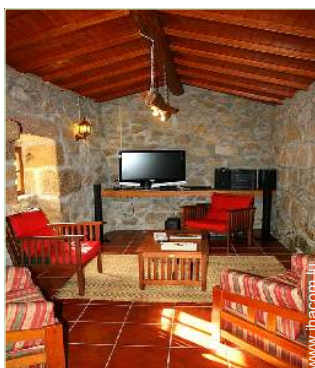
salon de musique