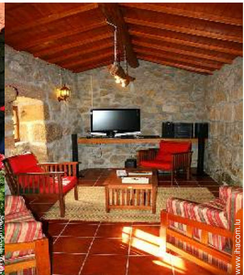
salon de musique