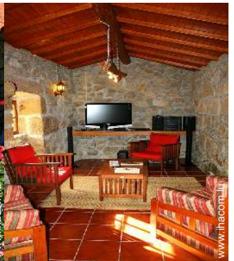
salon de musique