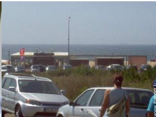
vue sur rue/avenue