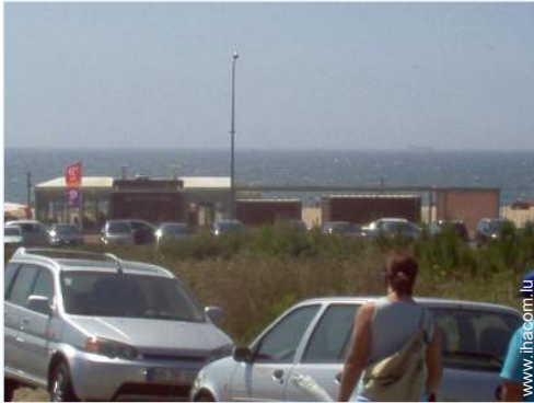
vue sur rue/avenue