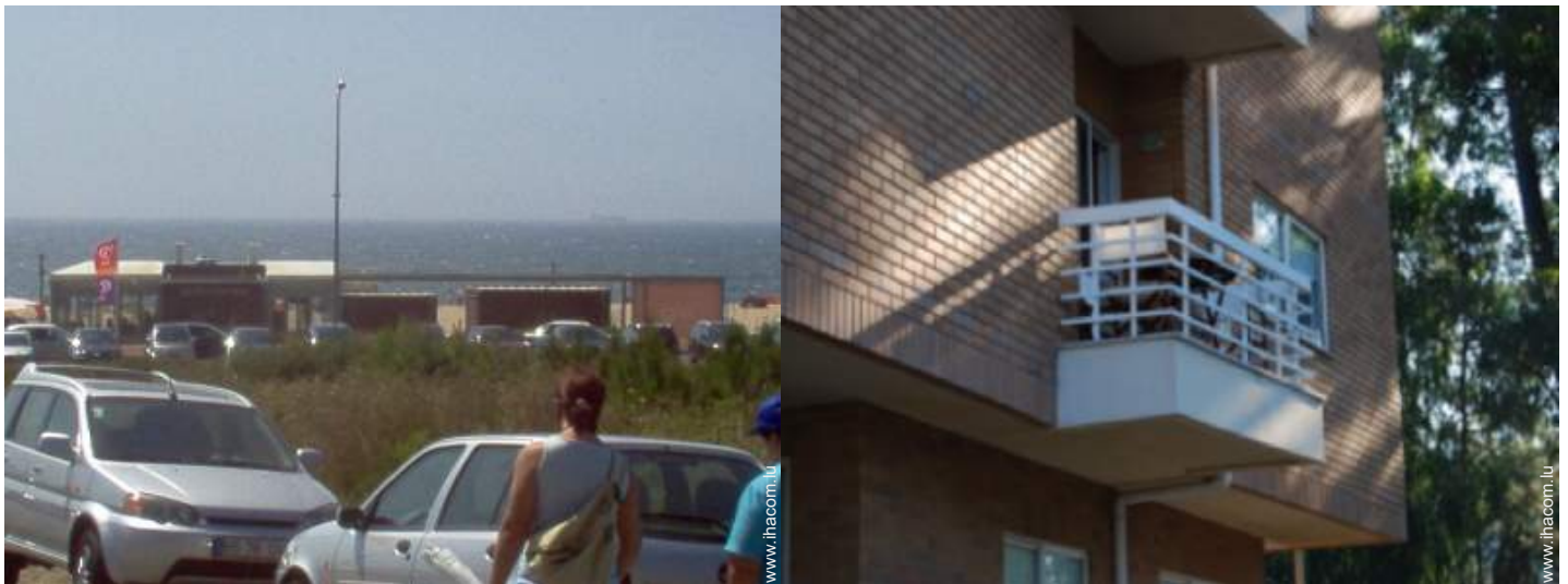
vue sur rue/avenue