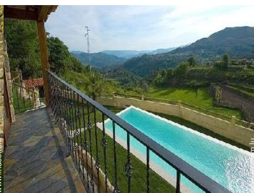
vue sur montagne