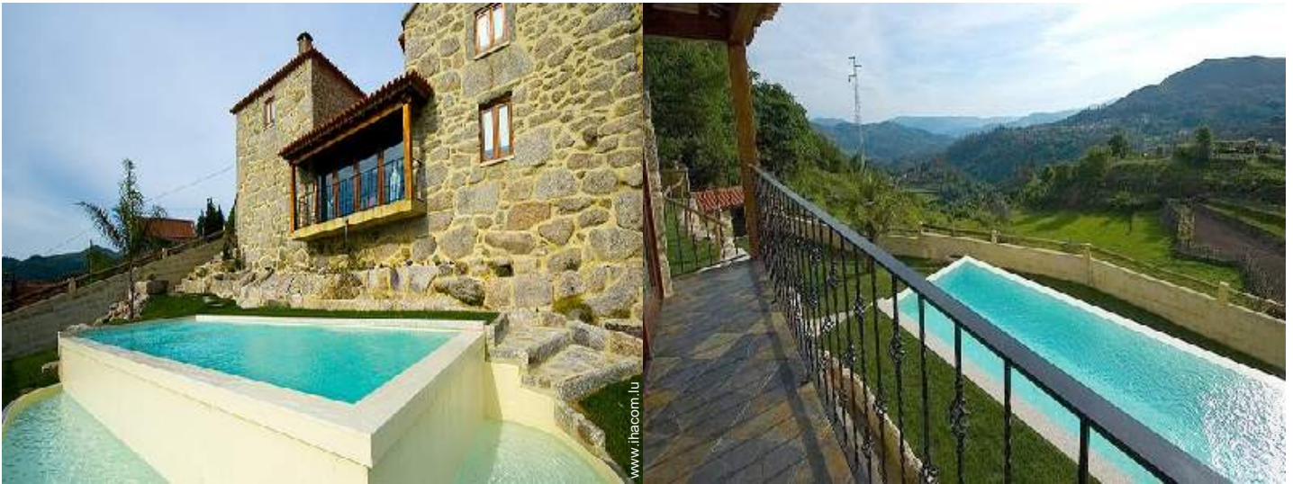
vue sur montagne