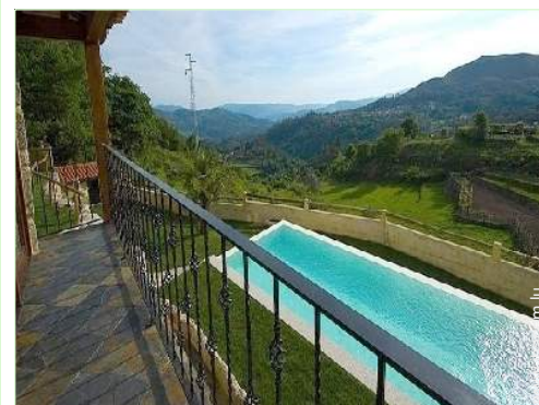
vue sur montagne