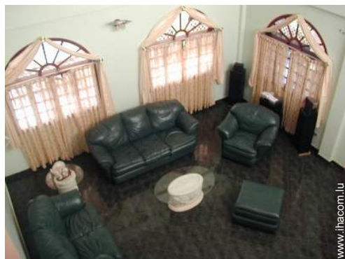
Propriété de Prestige