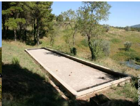
terrain de pétanque