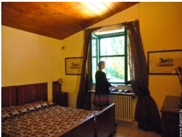
lits jumeaux simple