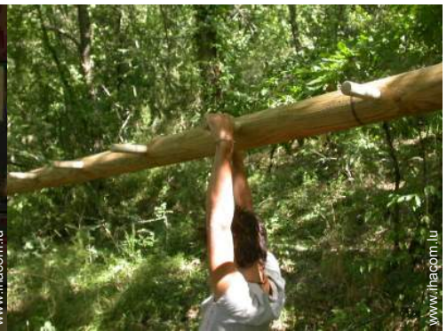
loisirs d'été à proximité