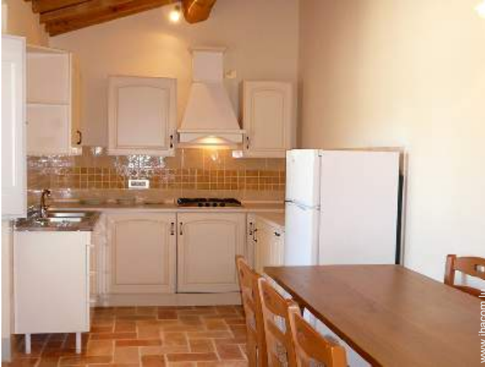
cuisinière à gaz