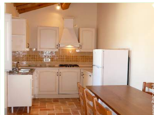
cuisinière à gaz

Barbecue, table(s) de jardin, chaise(s) de jardin, parasol, transat(s), balancelle, balançoire, douche extérieure, WC extérieur