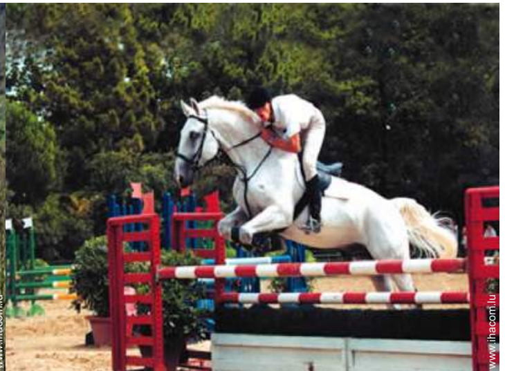
balade à cheval