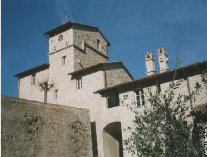
Mas de Charme