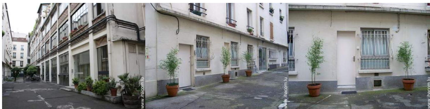
vue sur cour