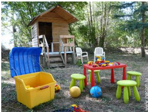
Equipements extérieurs à disposition des hôtes