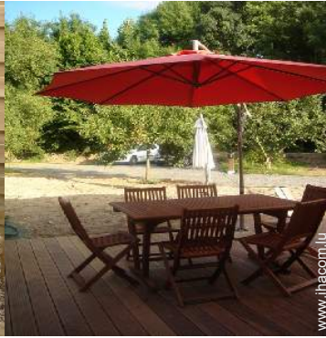
salon de jardin