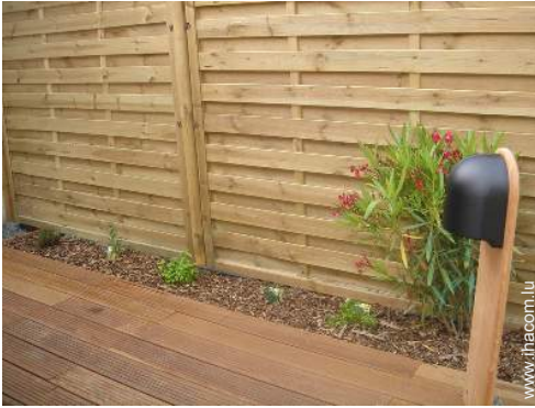
Installation extérieure à disposition des hôtes