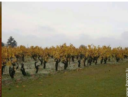
vue sur vignobles