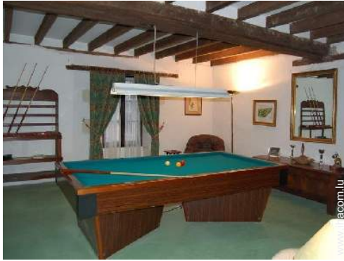
table de billard