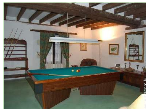
table de billard