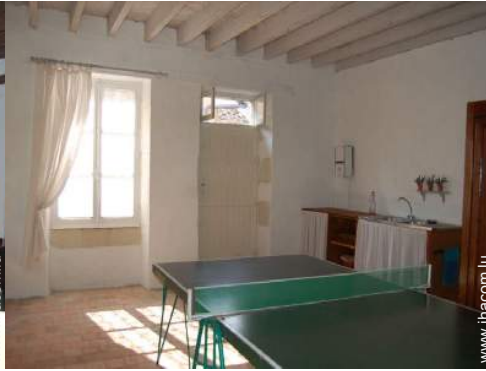
table de ping-pong