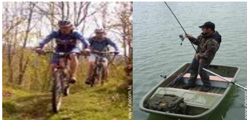
VTT (itinéraire circuit)