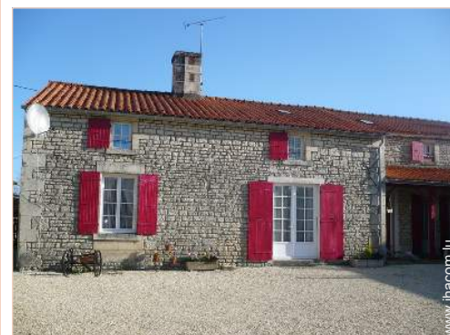
Ancien Corps de Ferme de Charme