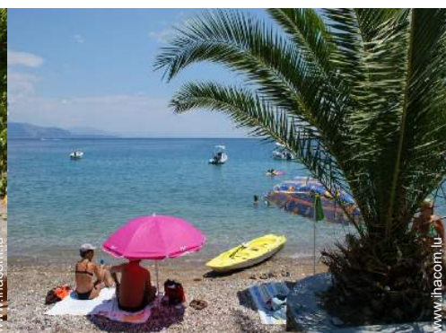
loisirs balnéaires à proximité