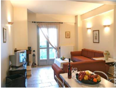
Confort intérieur et équipements