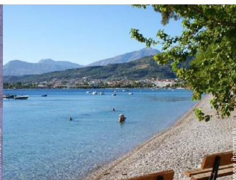
loisirs balnéaires à proximité