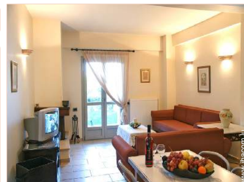
Confort intérieur et équipements