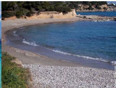
plage de rocher