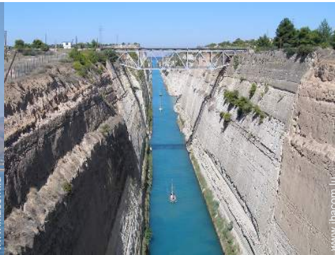
Attraits et détente