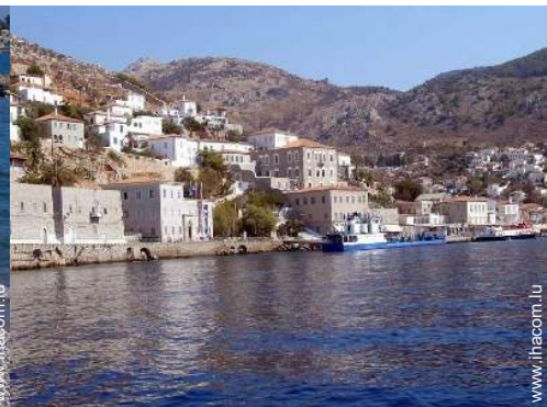
Attraits et détente