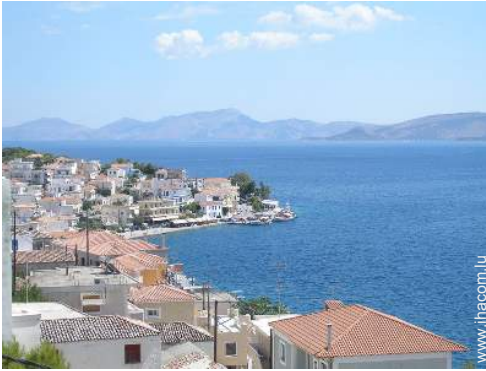
vue sur village