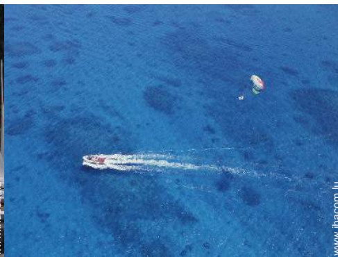
loisirs nautiques à proximité