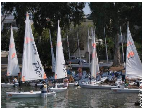
école de voile