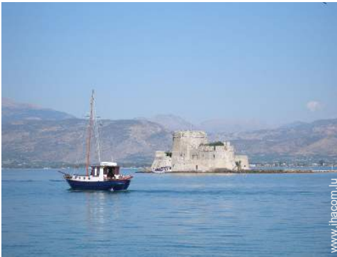
Attraits et détente