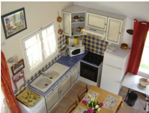
vue depuis la mezzanine