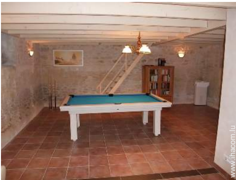
table de billard