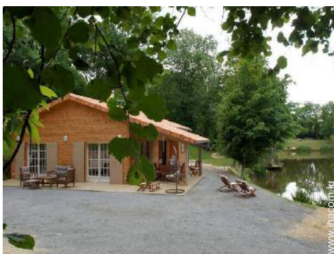
Maison de Charme en Bois