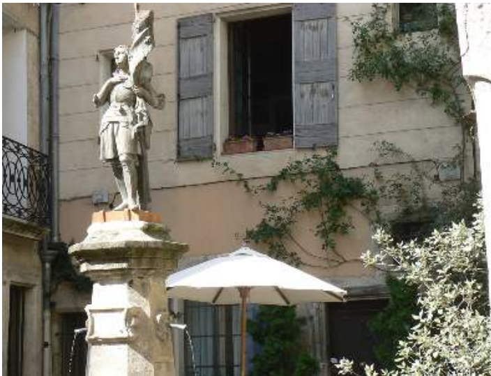
Maison de Charme en Pierre