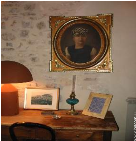
Confort intérieur et équipements