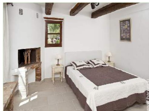
Confort intérieur à disposition des hôtes