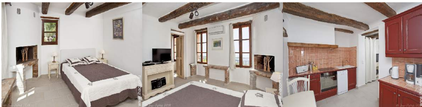
Confort intérieur à disposition des hôtes