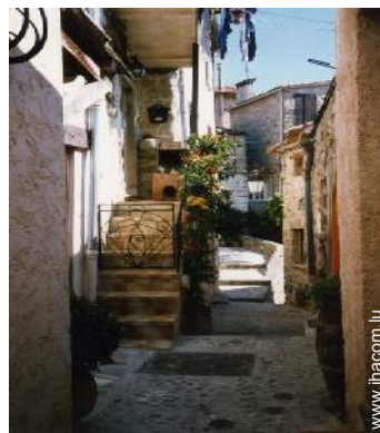
vue sur centre village