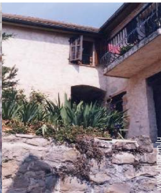
Maison de Village