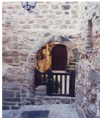
Maison de Village