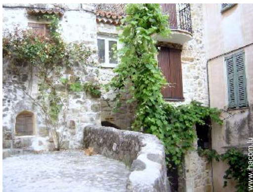
vue sur centre village