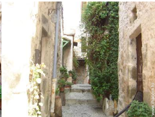
vue sur centre village