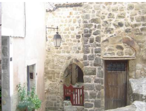
vue sur centre village