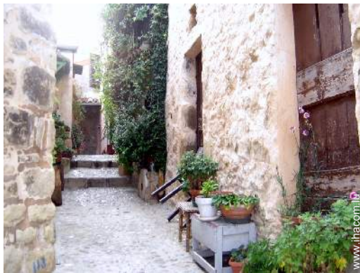
vue sur centre village