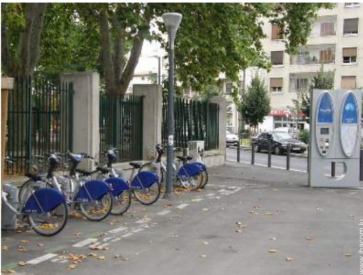
location de vélo/VTT