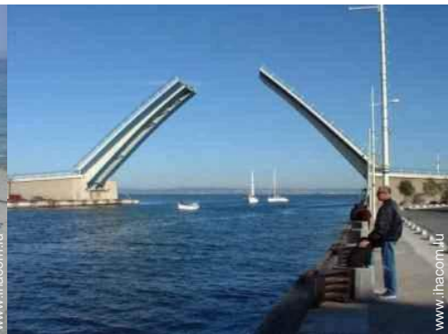
pêche à la ligne