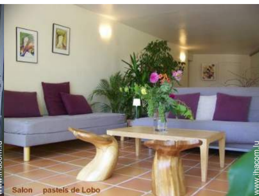
Salon pastels de Lobo