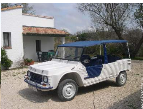
Présence sur place