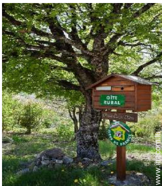
Chalet de Montagne de Charme