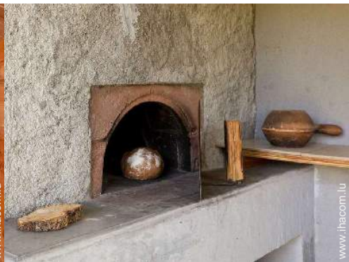
four à pizza