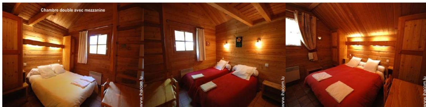
Chambre double avec mezzanine