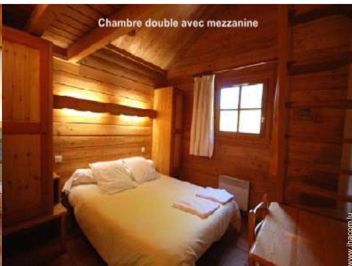
Chambre double avec mezzanine