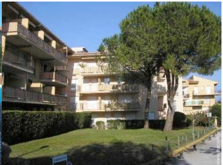
Résidence de standing