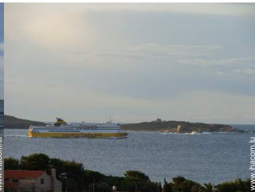
loisirs nautiques à proximité