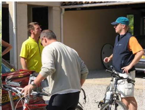
VTT (itinéraire circuit)