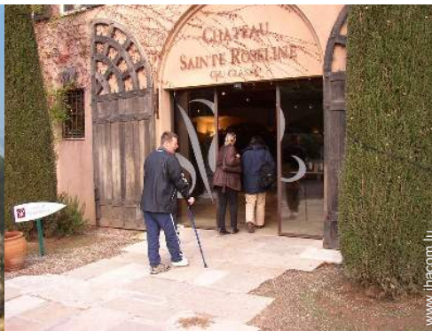
cave et dégustation de vin