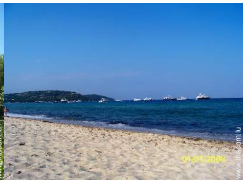
loisirs nautiques à proximité