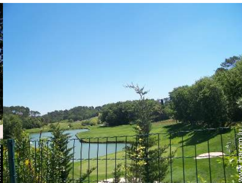
parcours de golf 18 trous