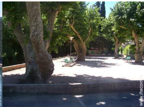
terrain de pétanque