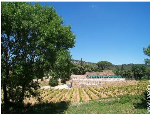
cave et dégustation de vin