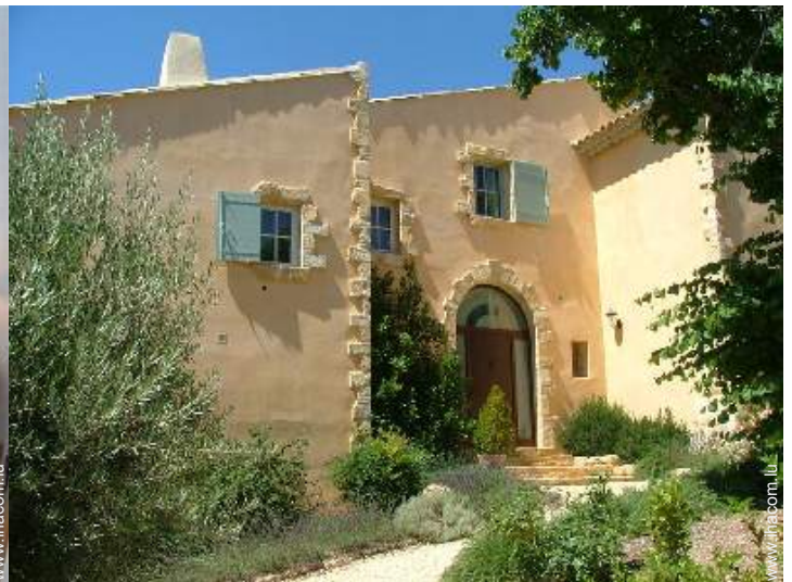
Maison Provençale de Prestige