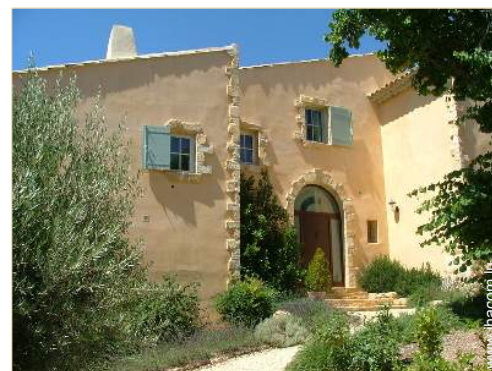
Maison Provençale de Prestige