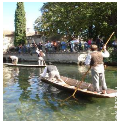
Attraites et détente