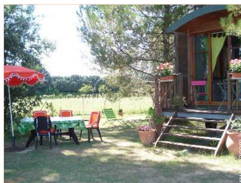
vue sur campagne