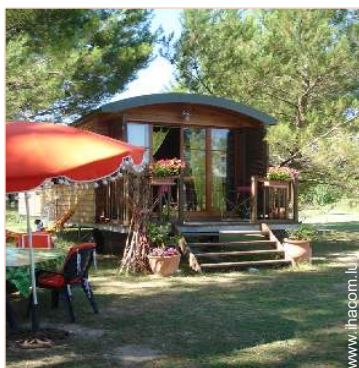
Roulotte de Charme