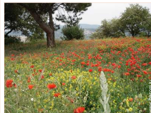
vue sur campagne