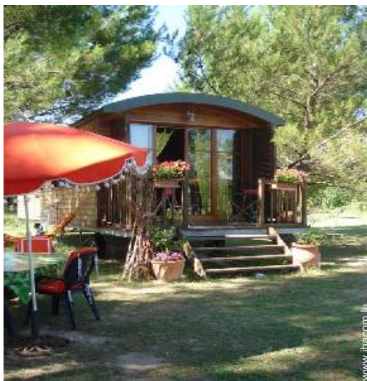
Roulotte de Charme