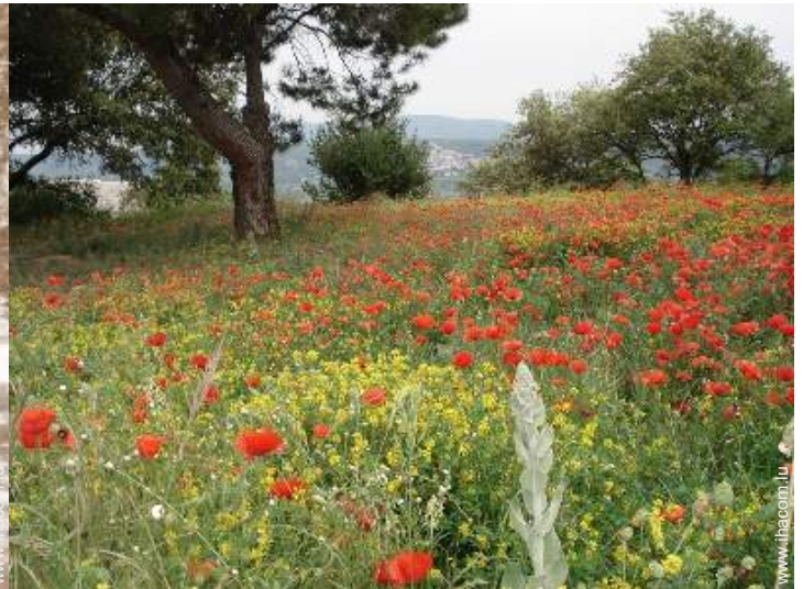
vue sur campagne