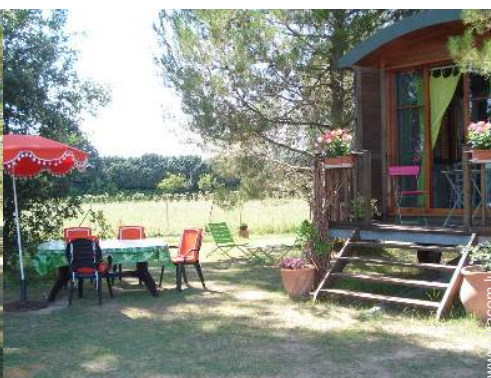
vue sur campagne