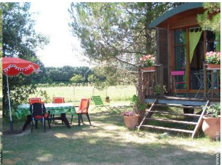
vue sur campagne