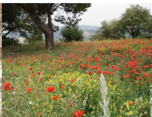
vue sur campagne