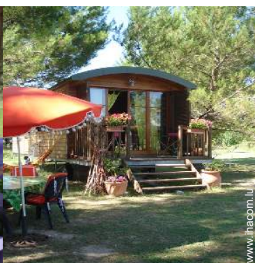
Roulotte de Charme