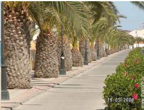
parc et jardin