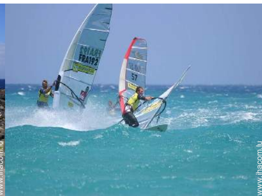
planche à voile