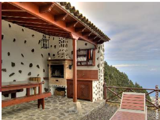
Equipements de loisir