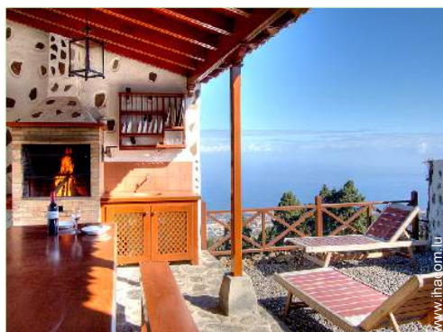
Installation extérieure à disposition des hôtes