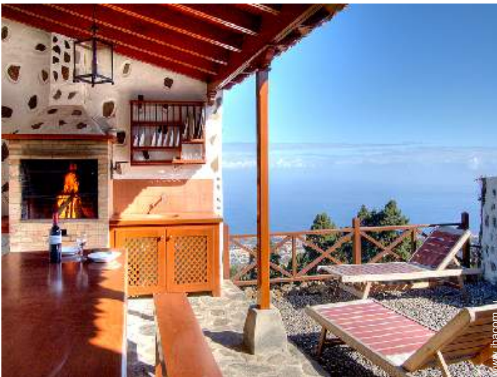
Installation extérieure à disposition des hôtes