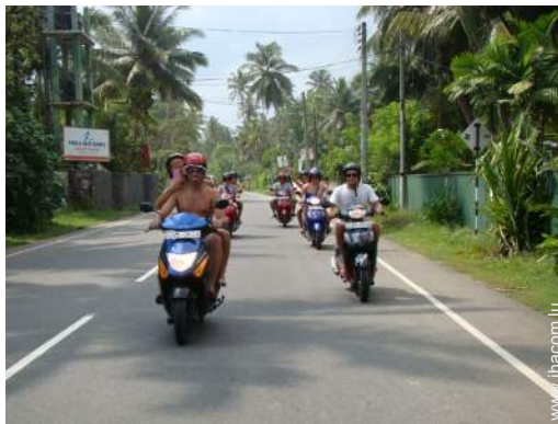
loisirs mécaniques à proximité