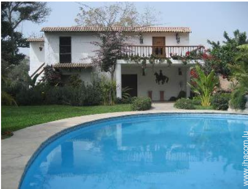
Bungalow de Prestige