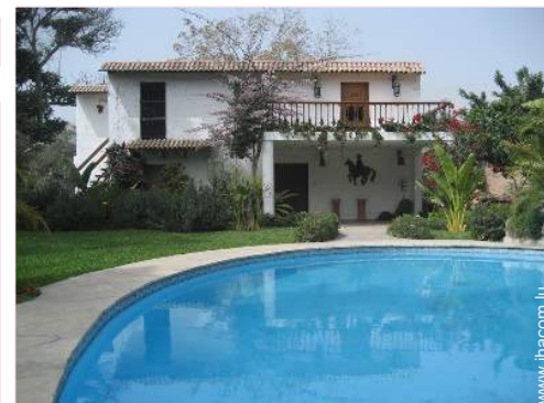
Bungalow de Prestige