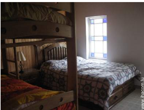
Bungalow de Prestige