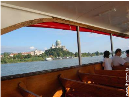
excursion en bateau