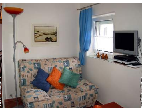
canapé-lit(s) 2 pers