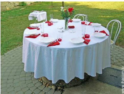
table(s) de jardin