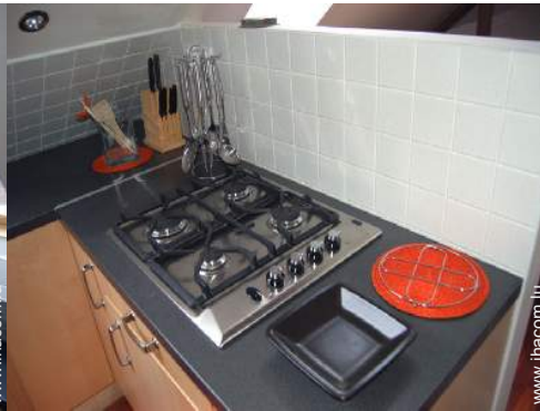
cuisinière à gaz