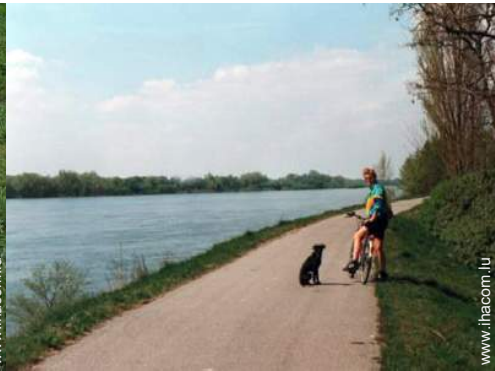
loisirs d'été à proximité