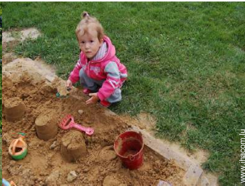
bac à sable