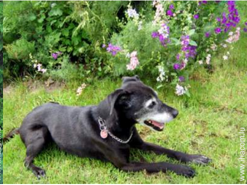
Les animaux de la maison