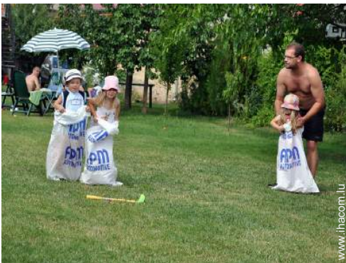
vue sur prairie