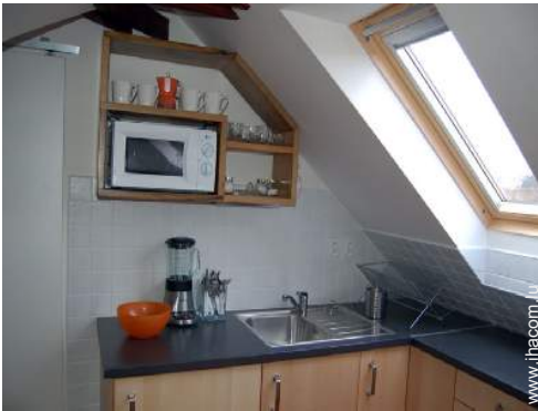
ustensiles et batterie de cuisine