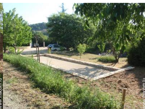
jeux de boules de pétanques