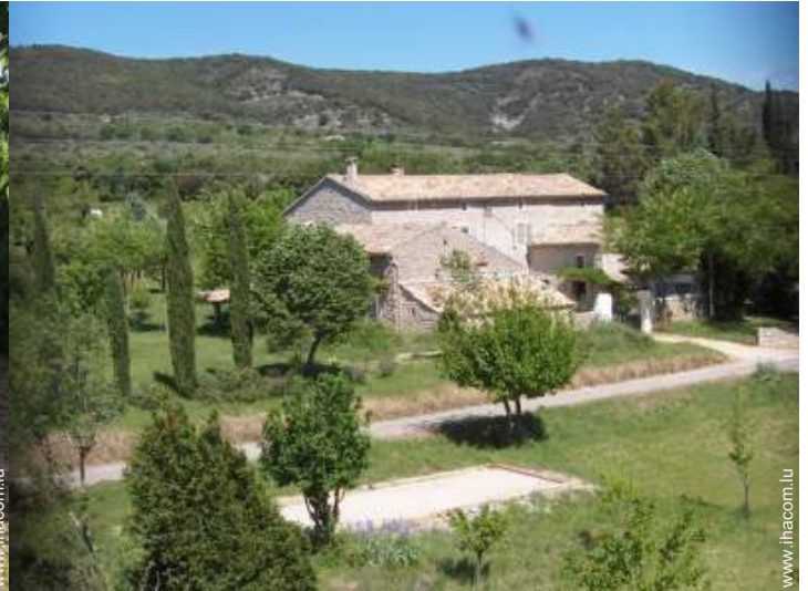
Mas de Charme