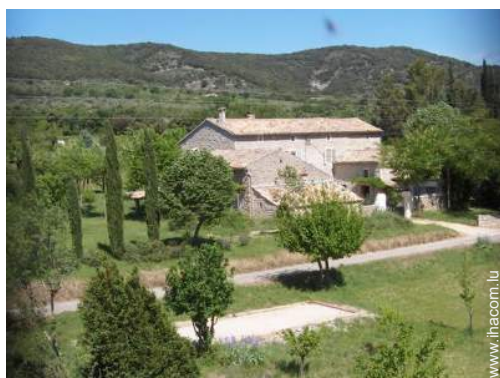
Mas de Charme