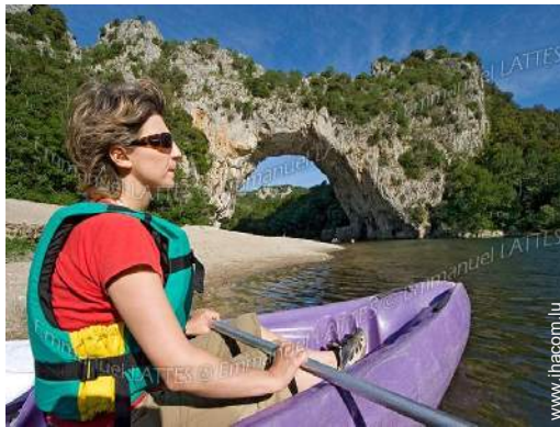
loisirs nautiques à proximité