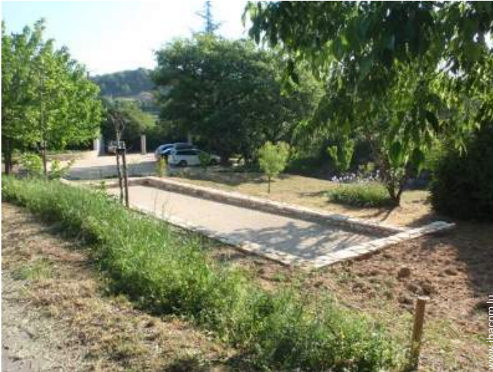
jeux de boules de pétanques