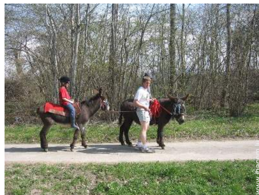
balade à dos d'âne