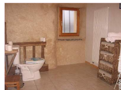
aménagement pour handicap