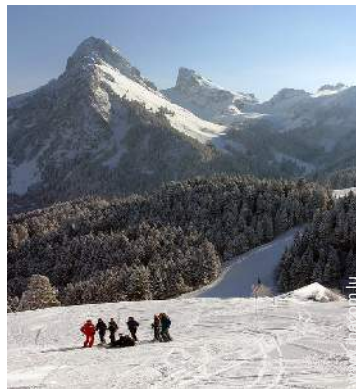
loisirs d'hiver à proximité