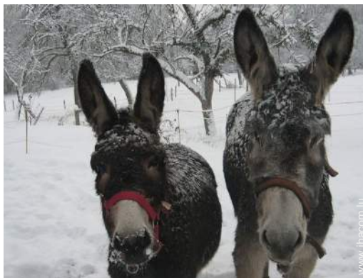
Les animaux de la maison