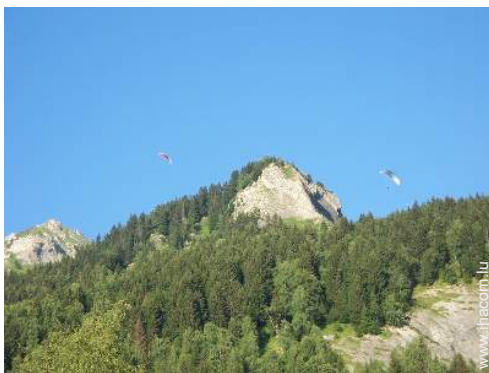
loisirs aériens à proximité