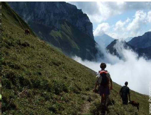
loisirs de montagne à proximité