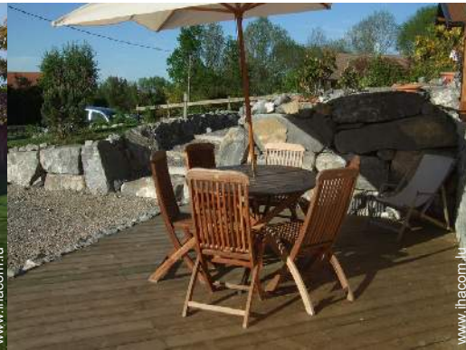
salon de jardin