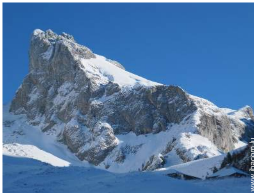
loisirs de montagne à proximité