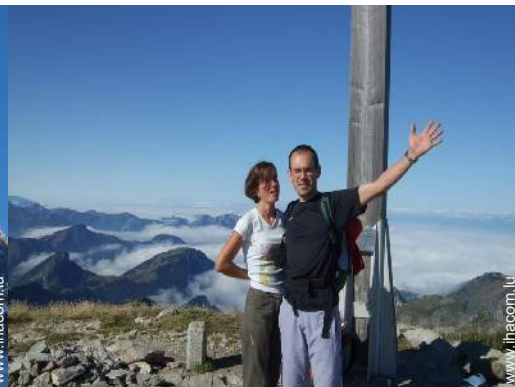
loisirs de montagne à proximité