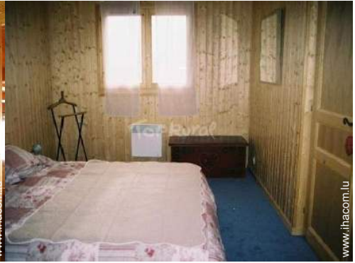
chambre du propriétaire