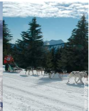
traîneau à chien