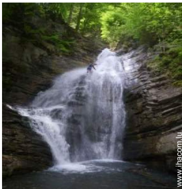
chemin de promenade