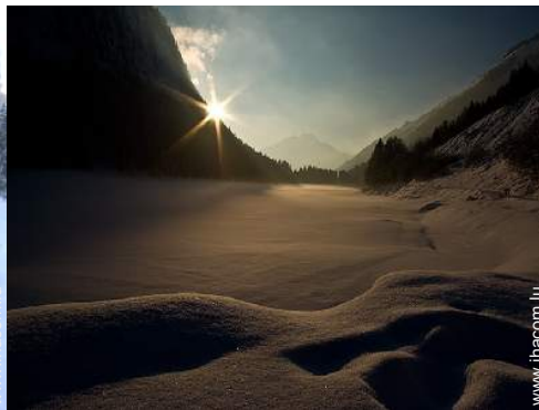
loisirs d'hiver à proximité