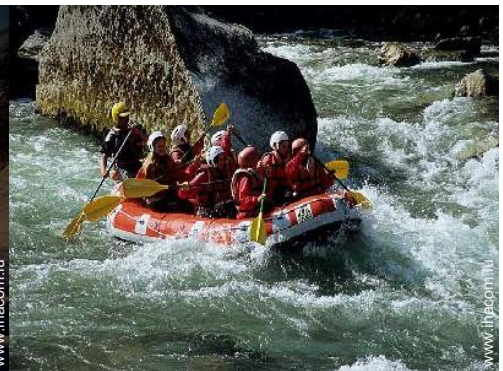
loisirs d'été à proximité