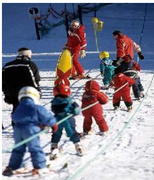
école de ski