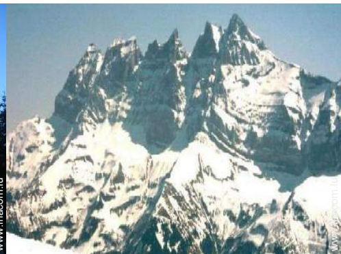
pistes de ski