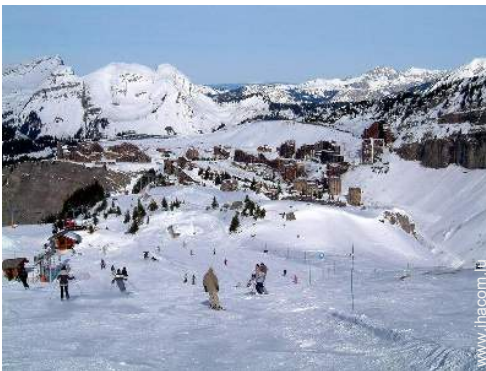
pistes de ski