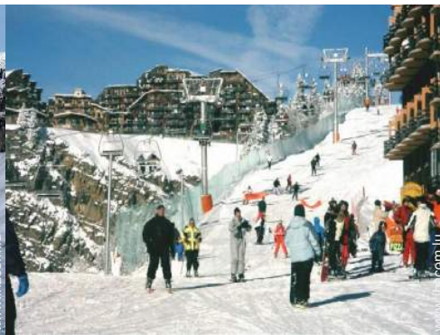
pistes de ski