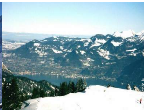
pistes de ski