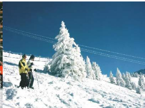
pistes de ski