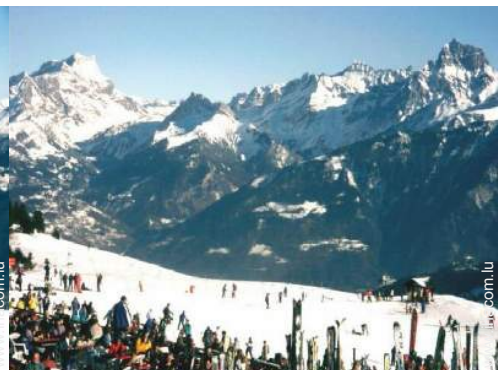
pistes de ski