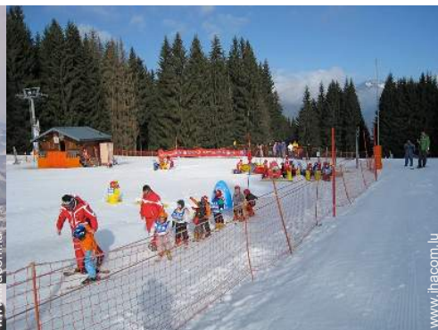
jardin de ski enfant