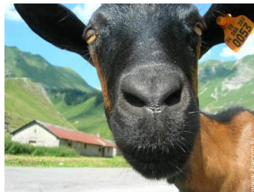
Présence sur place