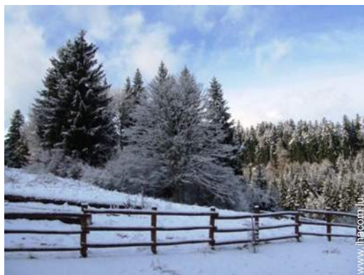
vue sur forêt