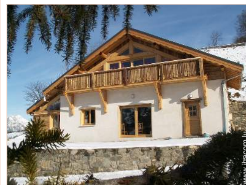
Chalet de Montagne de Charme