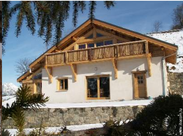
Chalet de Montagne de Charme