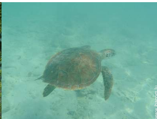
Présence sur place