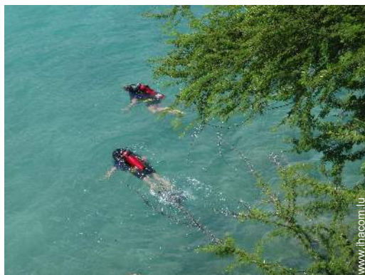
école de plongée