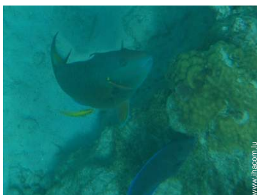
Présence sur place