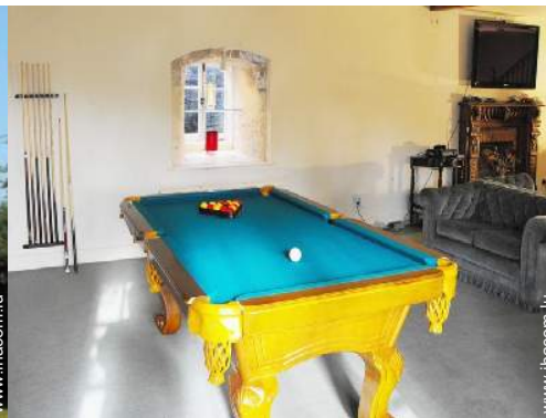
salle de jeux